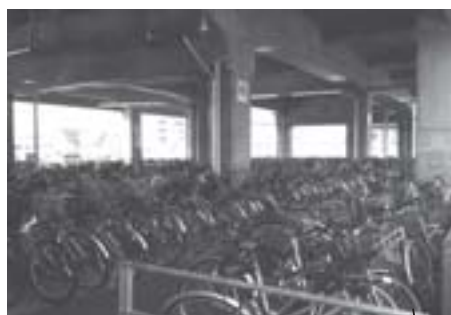
高架下駐輪場（岩見沢側）