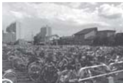
野幌駅南第三駐輪場