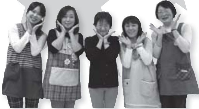
ほこあほこ スタッフの皆さん

ひろば内にはお子さんを見守ることができるよう、椅子などを配置しています。お子さんが元気に遊ぶのを見ながら、ゆったり過ごすことができます。